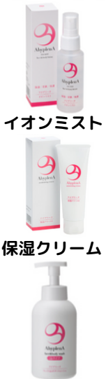
フェイス&ボディウォッシュ

2月は1年の中でも寒さが厳しく、空気の乾燥が一層気になる月です。空気が乾燥すると、肌や喉・鼻などの粘膜がダメージを受けてしまいます。当店がおススメしたいのが、アイプリーナシリーズです。アイプリーナには高い保湿性と経皮吸収性、さらに皮膚改善効果を兼ね備えた アセチルヒドロキシプロリン というアミノ酸誘導体が含まれており、肌にうるおいとハリを与えてくれます。ぜひお試しください(^^)/